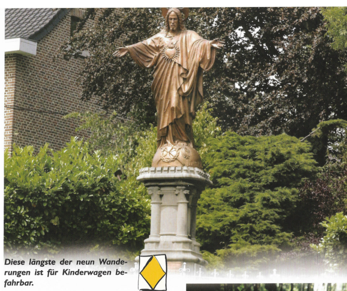
Diese längste der neun Wanderungen ist für Kinderwagen befahrbar.